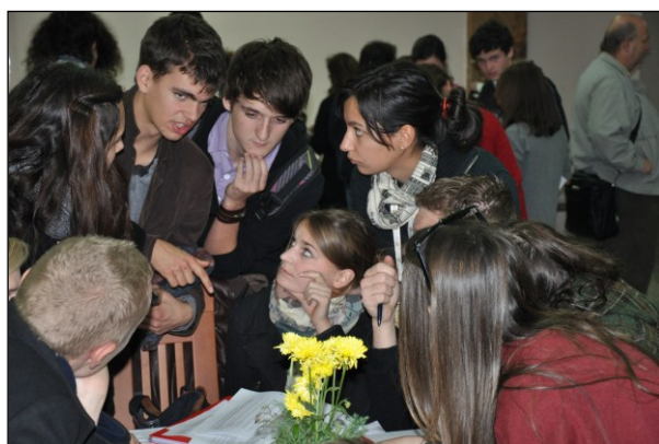
Delegatieleden van de internationale conferentie in Skopje tijdens de lobby voor hun resoluties.

Van 30 oktober tot en met 6 november 2011 werd in Skopje de internationale MEP-conferentie gehouden in samenwerking met de NOVA International Schools. Sinds de internationale MEP-conferentie in Skopje stellen de NOVA International Schools, met behulp van lokale autoriteiten en met ondersteuning van de Nederlandse ambassade in Skopje en het Model European Parlement in Den Haag, alles in het werk om een nationale MEP-organisatie in Macedonië op te zetten.