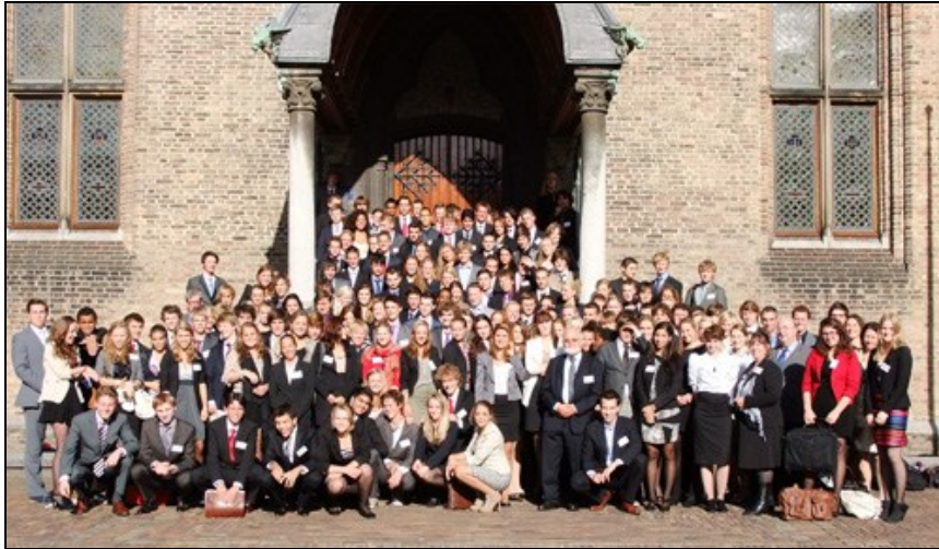
Deelnemers van de nationale conferentie voor de Ridderzaal op het Binnenhof.