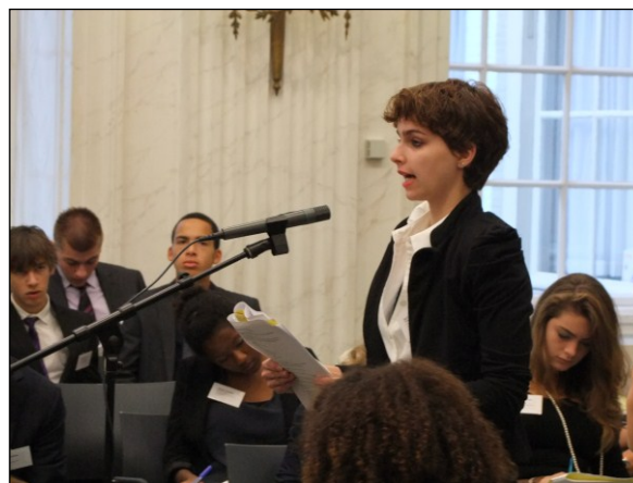
Een delegatielid licht haar standpunten toe.