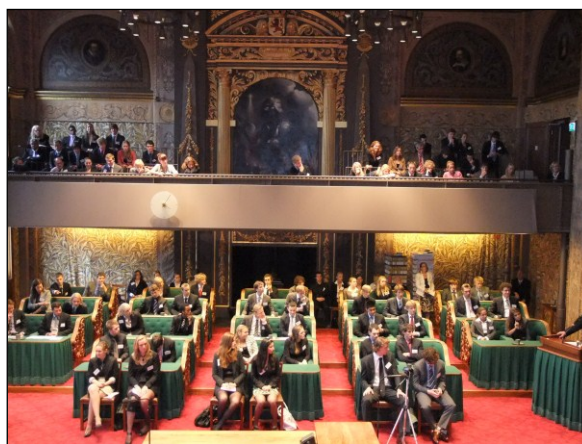
Officiële opening van MEP Nederland 2011 in de vergaderzaal van de Eerste Kamer.