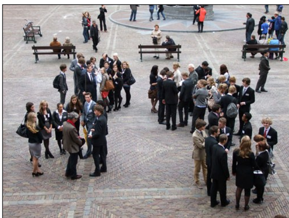
Delegaties verzamelen op het Binnenhof.