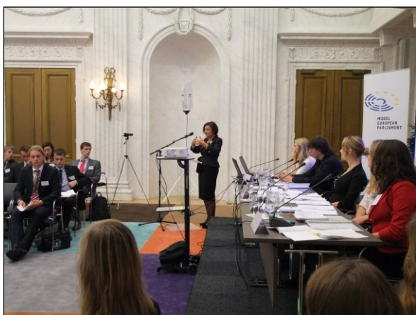
Opening Algemene Vergadering in de oude vergaderzaal van de Tweede Kamer door Kamervoorzitter Gerdi Verbeet.