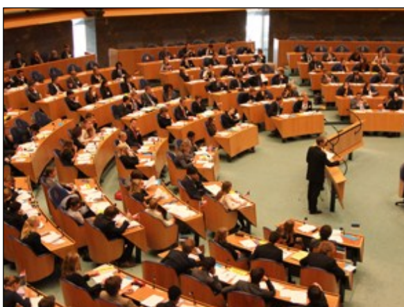
Algemene Vergadering in de plenaire zaal van de Tweede Kamer.