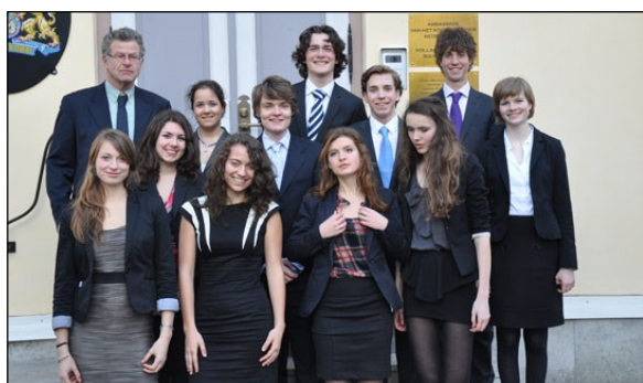
Nederlandse delegatie en coördinator in Tallinn.