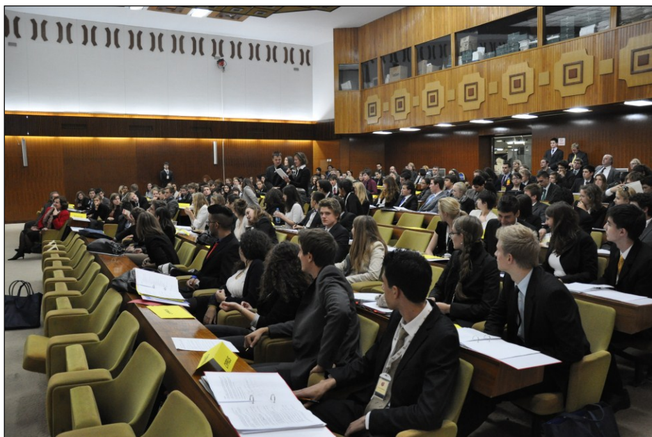
Deelnemers van de internationale MEP-conferentie Skopje in het parlamentsgebouw.