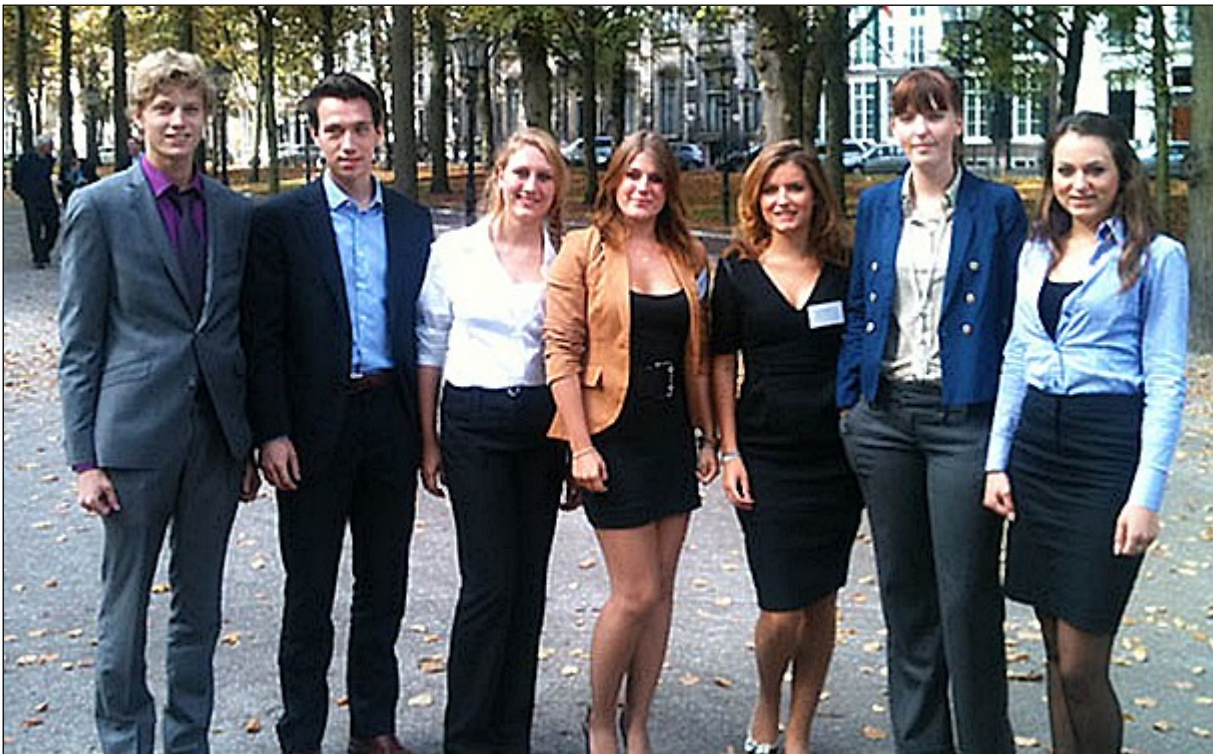
De redacteuren van de Model European Press op het Lange Voorhout in Den Haag.