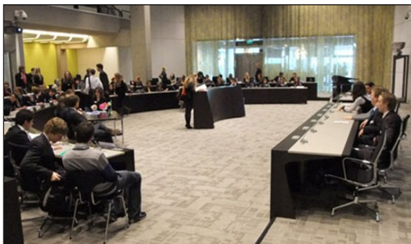
De provinciale conferentie van Zuid-Holland, Provinciehuis in Den Haag.