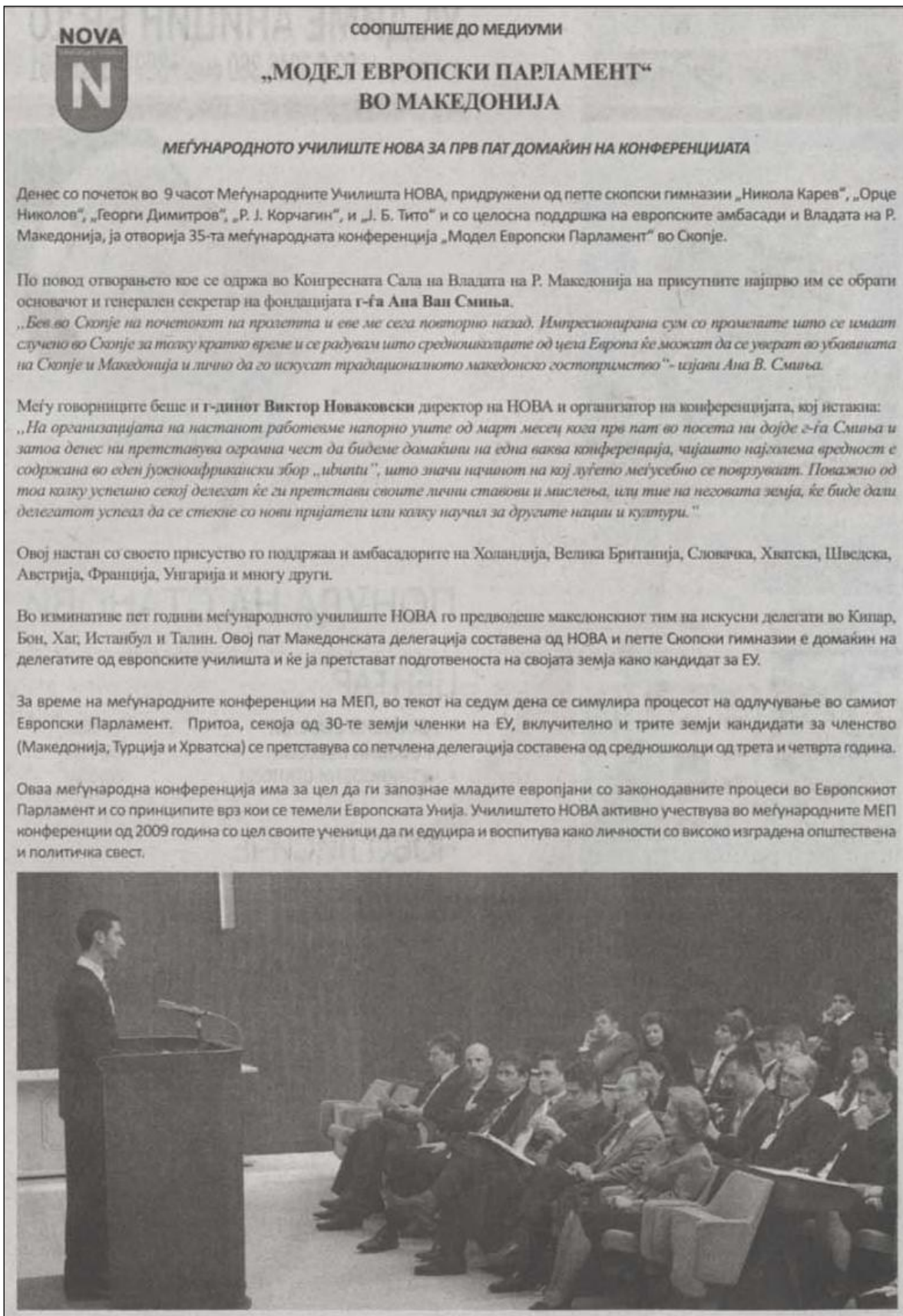
Artikel in de Macedonische krant NOVA Makedonija, november 2011