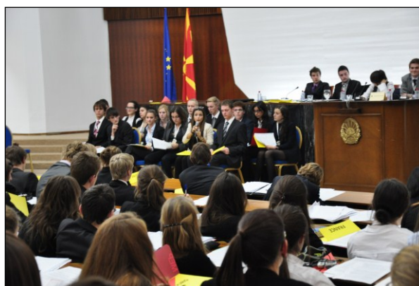
Een commissielid aan het woord in het Parlementsgebouw van de Republiek Macedonië.

Een greep uit de onderwerpen waar de jongeren in Skopje over discussieerden: