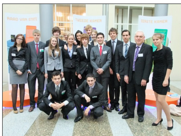
Delegatieleden en coördinator van de provincie Overijssel.