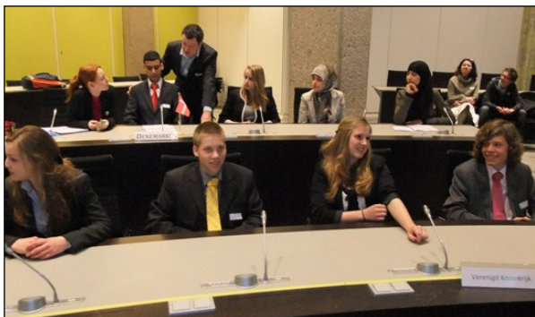
Delegatieleden in het Provinciehuis Zuid-Holland.