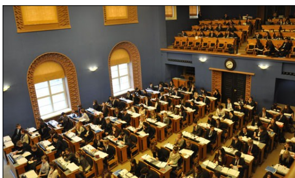
Parlement van Estland tijdens de General Assembly.