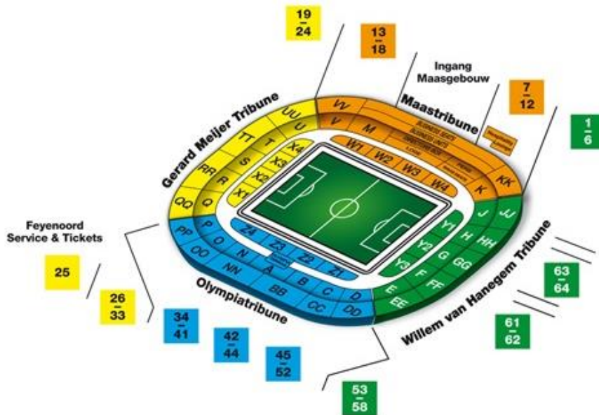
Figuur 1. Plattegrond van stadion De Kuip met de vakken (letters) en toegangspoorten (cijfers) naar de vakken.

Achter vak T worden enkele zakken over het hek gegooid. Dit wordt gezien door een politie-eenheid. De daders zijn niet meer te achterhalen. In de zakken worden 14 stuks vuurwerk aangetroffen. Voor de wedstrijd zijn er binnen de hekken rond het stadion een drietal 'pre match drinking sessions'. Bij een van deze sessies wordt door een persoon 'Hamas, Hamas, Joden aan het gas' door een microfoon gescandeerd. Dit is onder andere te zien op een video die op sociale media rond gaat 12 . Omdat er niet direct in kaart gebracht kan worden wie de verdachte is, en omdat het niet direct lukte om de microfoon uit te zetten, werd er niet direct ingegrepen. Feyenoord en De Kuip hebben gezamenlijk aangifte gedaan van dit incident.