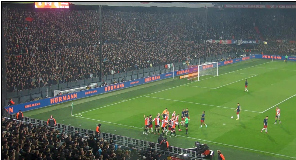
Figuur 14 Speler Feyenoord maakt sussende gebaren.