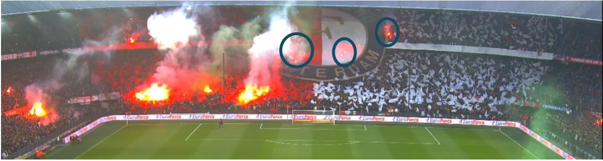
Figuur 4 Ongeveer hetzelfde moment als Figuur 2 en 3 uit een ander perspectief. Feyenoordvlag met meerdere fakkels eronder (omcirkeld) en eromheen, inclusief rookontwikkeling.

Op de bewakingsbeelden (specifiek 012 Gerard Meijer) is vlak voor de aftrap ook duidelijk te horen dat er 'Joden gaan eraan olé olé' gezongen wordt.