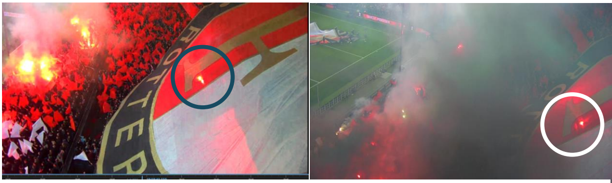
Figuur 2 en 3. Feyenoordvlag met fakkels eronder (omcirkeld) en eromheen, inclusief rookontwikkeling.

Rond de aftrap wordt op de Gerard Meijer Tribune een groot spandoek uitgerold waarop het logo van Feyenoord staat. Op de camerabeelden is te zien dat rondom het spandoek en onder het spandoek meerdere fakkels worden aangestoken.