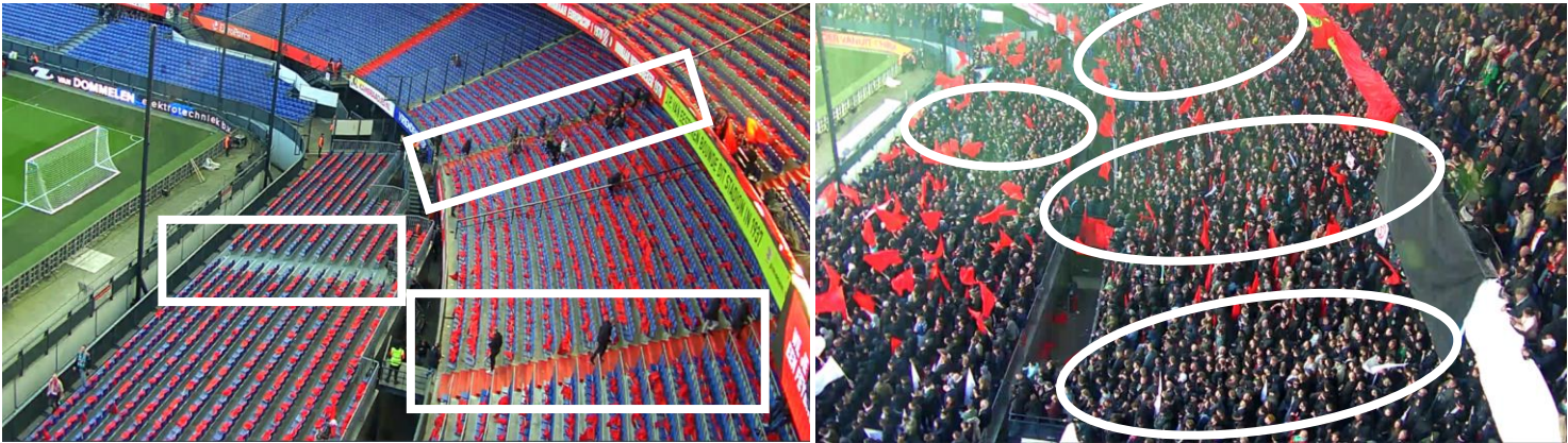
Figuur 7 en 8 Beeld van de lege Gerard Meijer Tribune en tijdens de wedstrijd. Omcirkeld zijn de locaties van de trappen. De figuur rechts geeft een iets grotere hoek weer. De drie bovenste cirkels zijn ook op de figuur links terug te zien in een rechthoek.