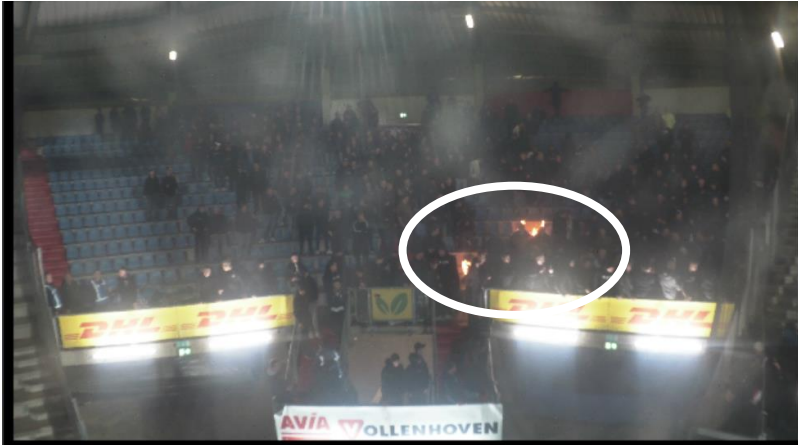
Figuur 17 Still van bewakingsbeelden van Willem II met omcirkeld waar de brand zichtbaar is.

Beide voorbeelden zijn niet hetzelfde als de in dit onderzoek belichte wedstrijd Feyenoord – Ajax, omdat bij Ajax – Feyenoord (maart 2022) de trappen (redelijk) leeg waren en omdat bij Willem II – FC Den Bosch het vak veel leger was en er geen vlag, maar stoeltjes brand hadden gehad.