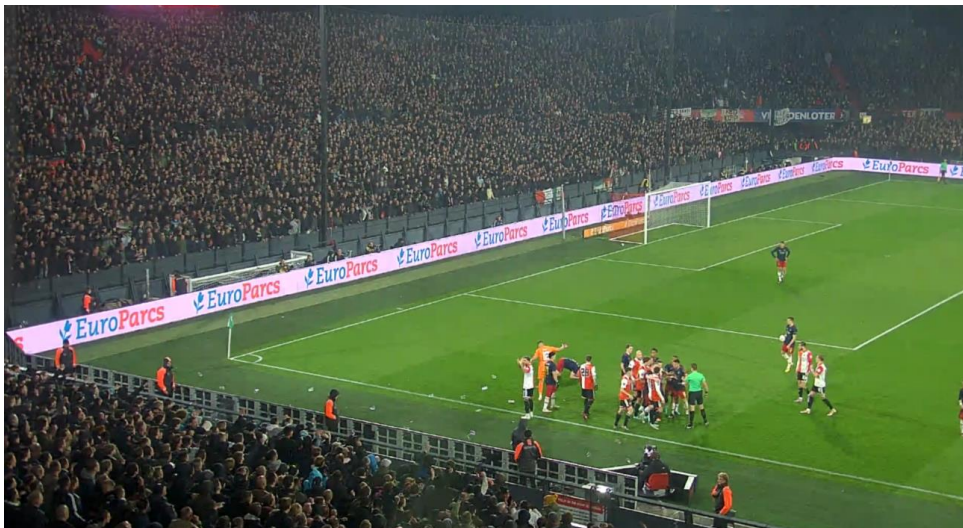
Figuur 13 het moment dat Davy Klaassen geraakt wordt door een aansteker.