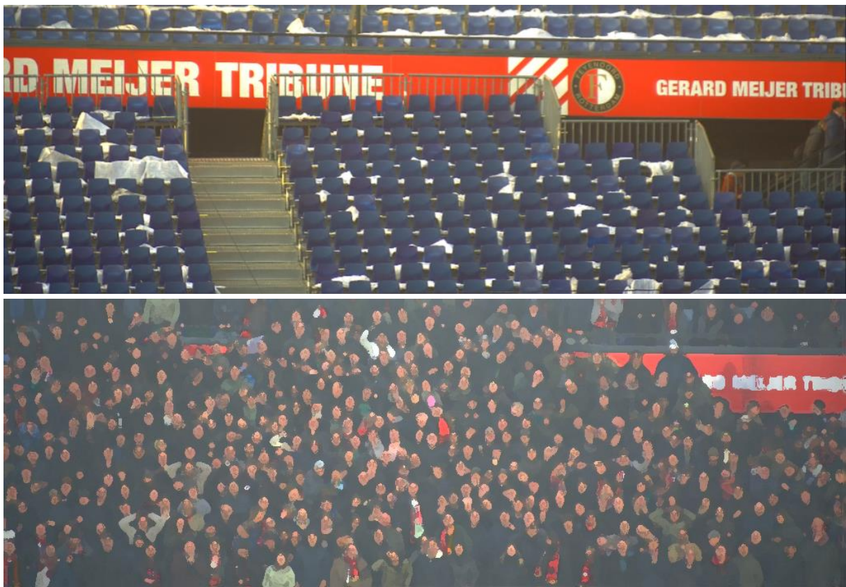
Figuur 9 en 10. Screenshots van dezelfde positie op de Gerard Meijer Tribune, zonder en met (geanonimiseerd) publiek, waarop duidelijk te zien is dat de trap niet vrijgehouden wordt.

Er wordt iemand naar de rode trap toegestuurd om door te geven dat mensen niet op de trap mogen staan. Uit documentatie die na de wedstrijd is opgesteld, blijkt dat het publiek in de sectoren groen en wit boos is vanwege de overvolle vakken 13 .