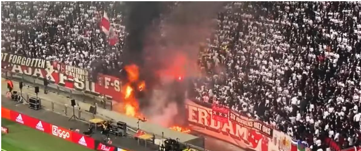
Figuur 16 Still van YouTube waar de brand bij de wedstrijd duidelijk zichtbaar is.

Het risico dat hier onderstreept wordt, komt voort uit eerdere onderzoeken die wij gedaan hebben en wat daarin bevonden is. In het afgelopen jaar heeft het Auditteam vooronderzoek gedaan naar Ajax – Feyenoord op 20 maart 2022, waarbij een zeer grote (geïmpregneerde) vlag, waarop Carlo Picornie op afgebeeld stond, vlam vatte. Deze was voor het grootse gedeelte op de grond in de gracht gekomen, maar nadat er enkele fakkels op beland waren, ontstond een grote brand.