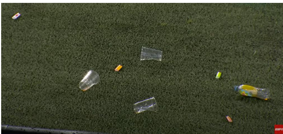
Figuur 15 Still van een ESPN-beeld op YouTube met gegooid voorwerpen, waaronder vier aanstekers.