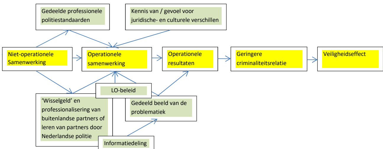
Figuur 2.2: Aangevulde centrale causale redenering

Schematisch kunnen deze aanvullende veronderstellingen als volgt worden weergegeven. Hierin zijn de factoren boven de centrale causale as randvoorwaarden die geacht worden te bestaan, maar waarop het beleid niet actief stuurt. De factoren onder de centrale causale as worden wel beïnvloed door het beleid zelf.