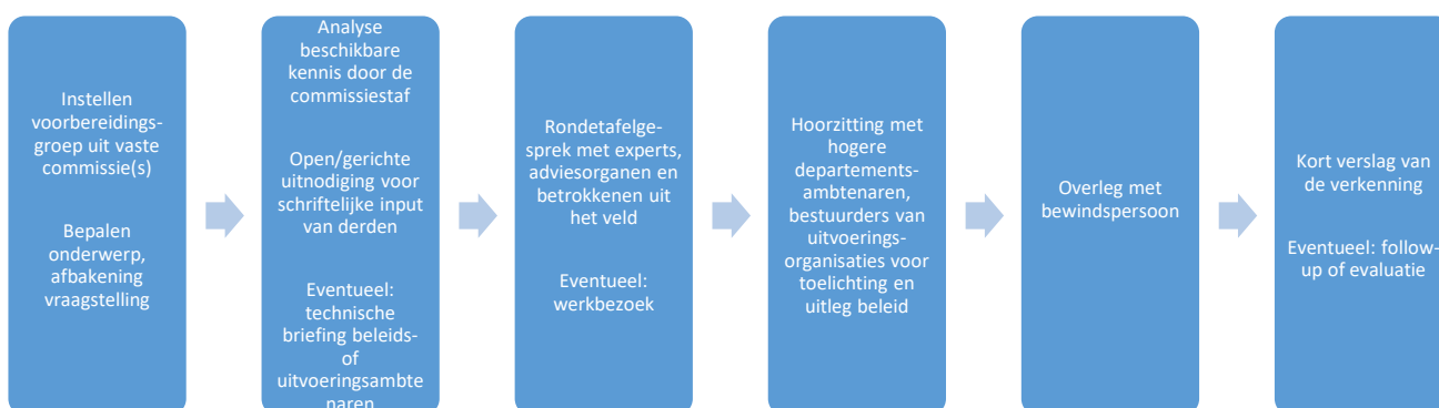
Figuur 2 Mogelijke opzet van een 'parlementaire verkenning'

Een verkenning leent zich met name wanneer er complexe vragen spelen over de uitvoering van nieuw of bestaand overheidsbeleid dat grote impact heeft op (groepen) burgers. De commissie kan dan - op basis van eigen onderzoek en met ondersteuning van de staf - de inzichten van deskundigen, belanghebbenden en betrokken ambtenaren in kaart te brengen aan de hand van gerichte onderzoeksvragen. Deze inzichten kunnen input vormen voor het overleg met de bewindspersoon.