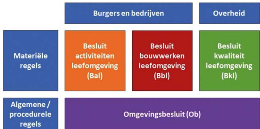
Figuur 1.1: De indeling van de AMvB's

De indeling van de AMvB's naar doelgroepen en type regels is gevisualiseerd in figuur 1.1.