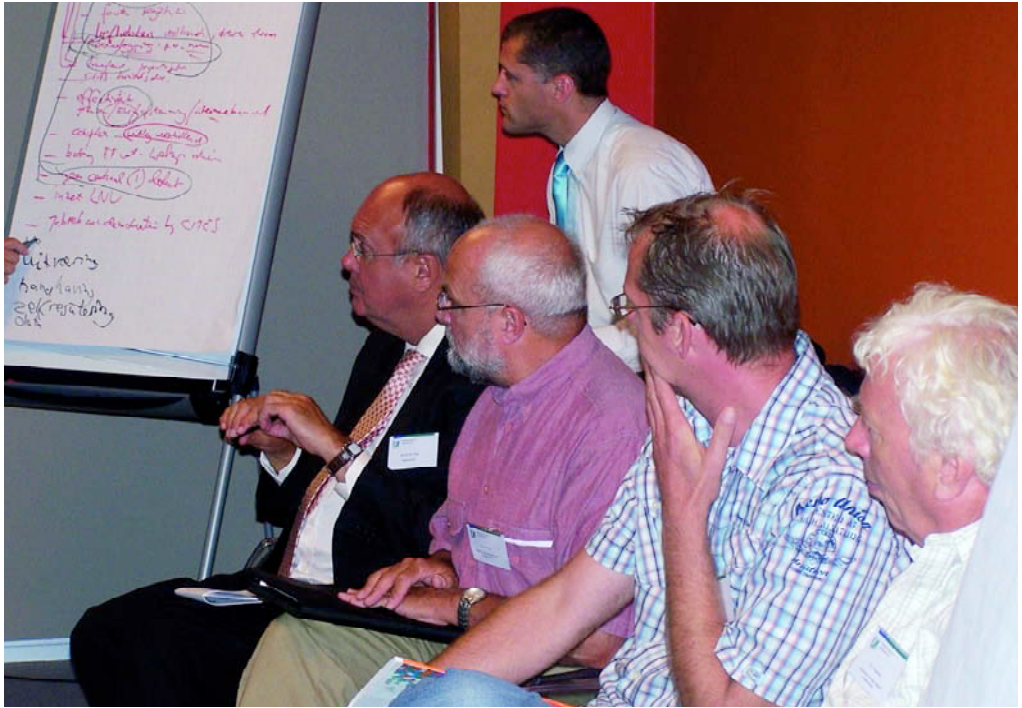
Er bleek onder de aanwezigen veel behoefte aan het aanvragen van CITES-documenten per Internet.