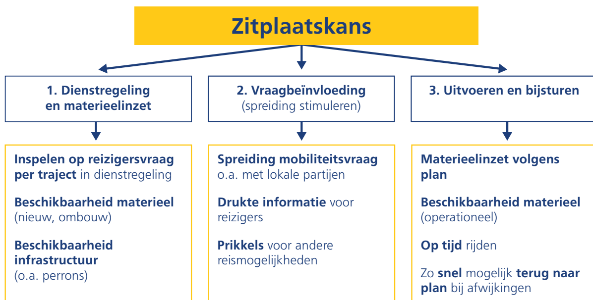
Figuur 2: Drie terreinen waarop NS de zitplaatskans verhoogt.

Via de eerste pijler, dienstregeling en materieelinzet, zetten we in op het vergroten van de zitplaatscapaciteit in de dienstregeling door bijvoorbeeld frequentieverhogingen en de beschikbaarheid van materieel. In de dienstregeling 2023 hebben we over het algemeen de zitplaatscapaciteit op voldoende niveau weten te brengen door het aanbod (de treinlengtes die ingezet worden) zo goed mogelijk aan te passen aan de vraag (de reizigersaantallen). Op de HSL-Zuid hebben we in 2023 het aanbod aangepast aan de vraag door in de spits de treinfrequentie op het drukste deeltraject hoog te houden. Waar het tot nu toe ingezette ICR-Traxx-materieel vaste treinlengtes kent, kunnen we in 2024 met de komst van de ICNG ook de treinlengte aanpassen aan de vraag. In 2024 breiden we daarnaast de dienstregeling uit ten opzichte van 2023. Het betreft circa 1.800 treinen per week meer dan in 2023.