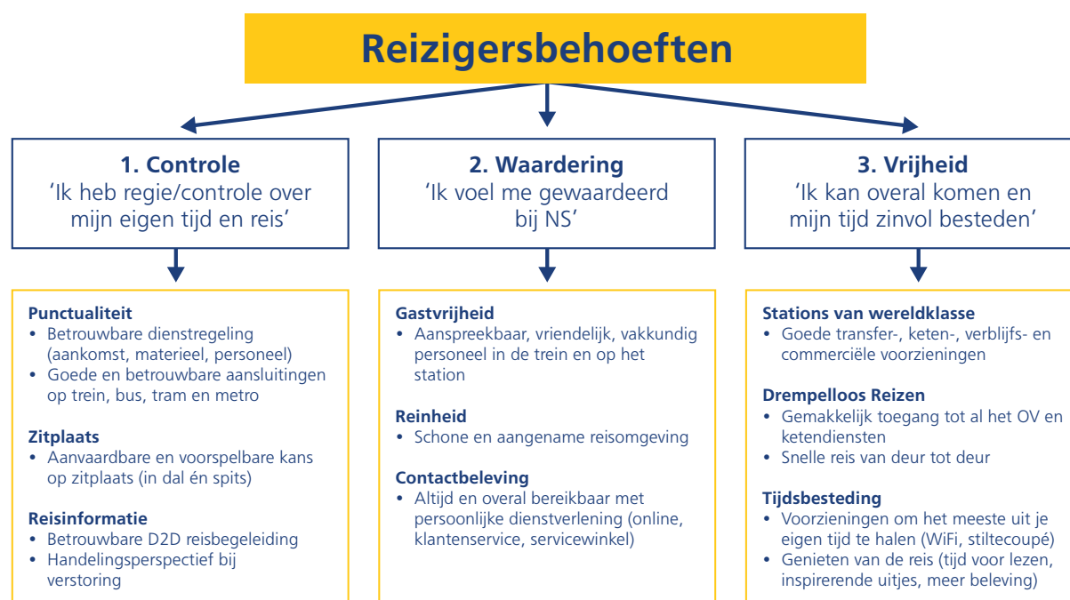
Figuur 1: Onze prestaties op bovenstaande negen thema's beïnvloeden gezamenlijk het Algemeen klantoordeel.

We streven naar zowel betere prestaties op de satisfiers als het op peil houden van het prestatieniveau voor de dissatisfiers . Daarbij zijn keuzes nodig om het spoorvervoer van hoge kwaliteit en betaalbaar te houden. Zo werken we aan het realiseren van de doelstellingen op alle prestatie-indicatoren, waaronder het Algemeen klantoordeel. In de volgende paragrafen zetten we per thema uiteen wat de relatie is met de klanttevredenheid en wat we doen om de tevredenheid van onze reizigers op een hoog niveau te houden.