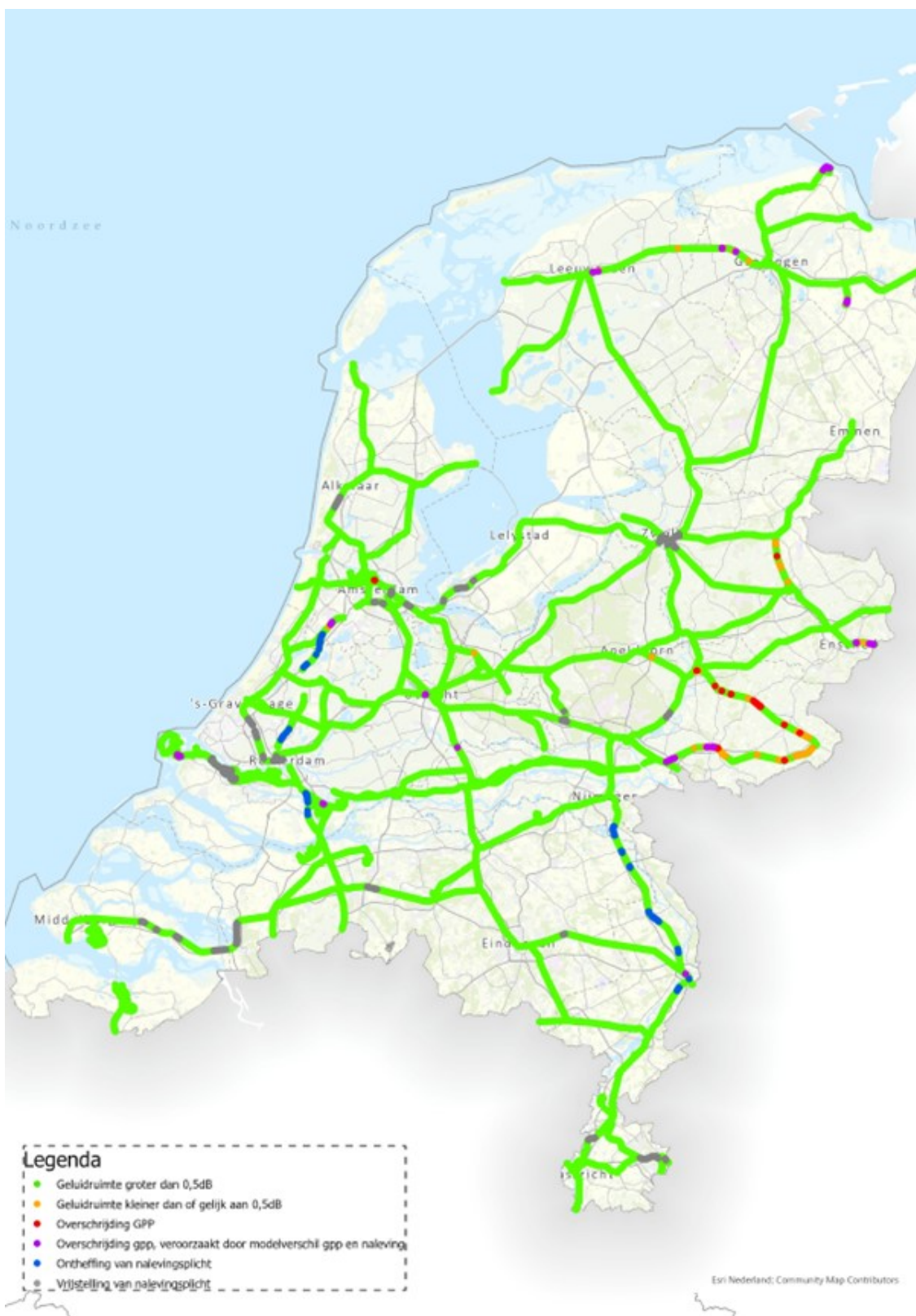
Figuur 2: Landelijk beeld van de gpp-naleving in 2022