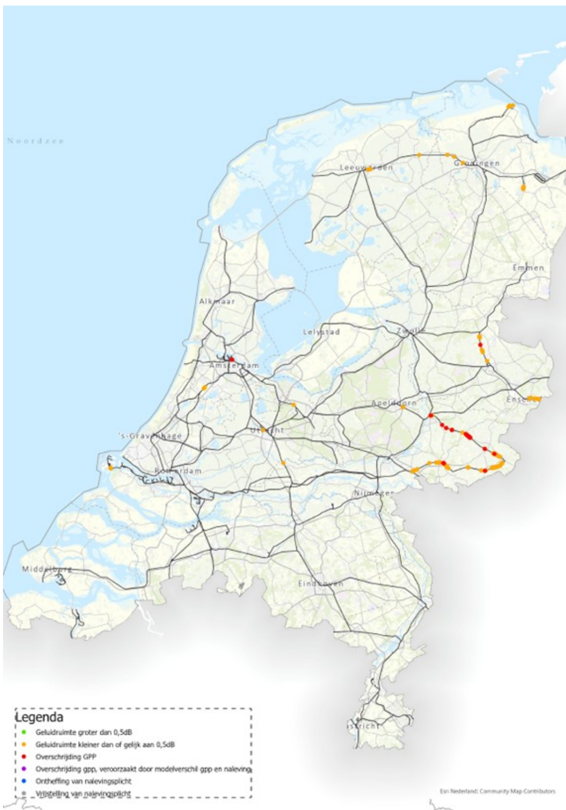
Figuur 1: Landelijk beeld van gpp-overschrijdingen en baanvakken met een krappe geluidruimte