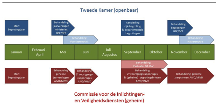
Begrotingsbehandeling en financiële verantwoording AIVD/MIVD

Hieronder volgt een korte toelichting op de stukken die in de commissie besproken worden in het kader van de begrotings- en verantwoordingscyclus.